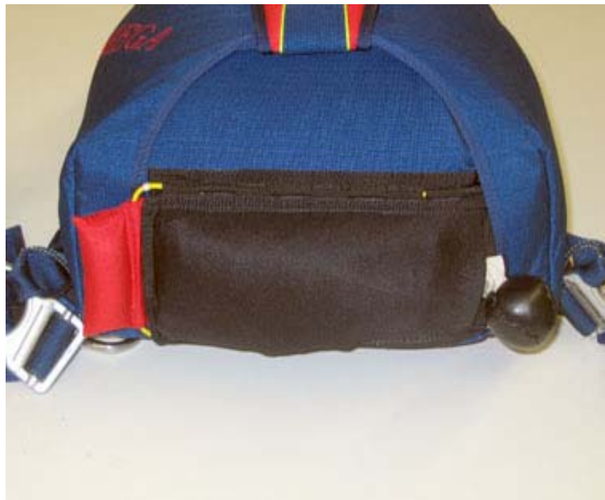
Aufziehvorrichtung des Hauptfallschirmes für den linken Lehrer bei der Schülersausbildung nach der AFF Methode.